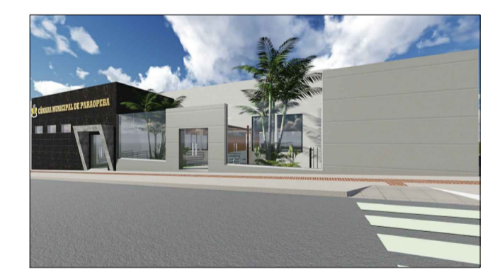
FACHADA PRINCIPAL - RISCOS E PÓRTO