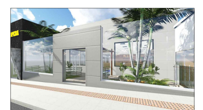
FACHADA PRINCIPAL - RISCOS E PÓRTO